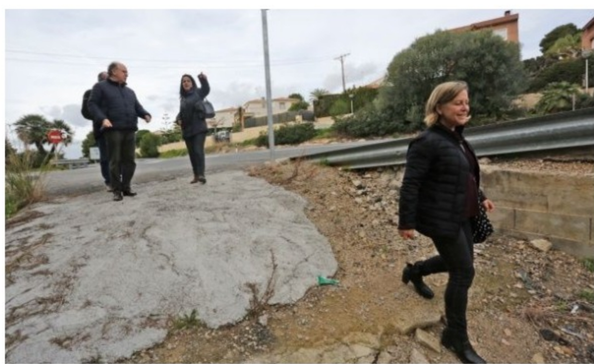
Vial que da acceso al puente soterrado para ir a Solimar, que está en pésimas condiciones.

La Associació de Veïns de Solimar-Molnàs ha presentado al Ayuntamiento de Tarragona un escrito firmado por 170 de los 400 vecinos del barrio en el que expone su malestar por la reciente eliminación de la parada de la EMT que estaba en el barrio, en dirección Barcelona para llegar hasta La Móra-Tamarit. Los responsables municipales justifican la decisión en base a la "peligrosidad" que, consideran, tenía este punto, que era principalmente de bajada de los usuarios. Por ello, la compañía municipal suprimió la parada , que estaba situada frente a la gasolinera Jaume I, el pasado 24 de abril .