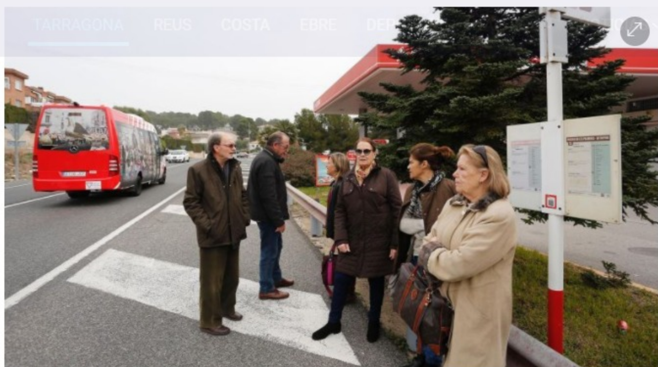
Varios vecinos de Solimar, recientemente, en la parada suprimida de Solimar