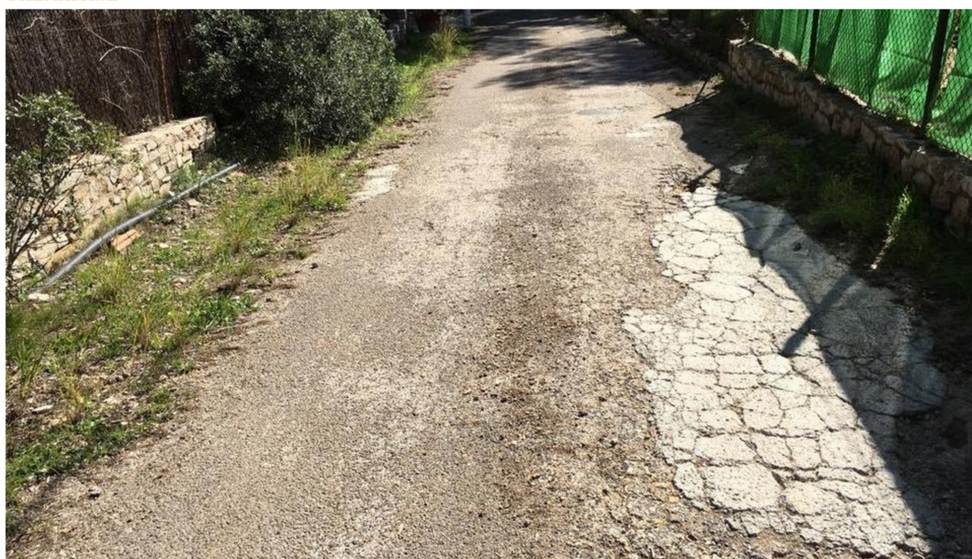
Estat actual en què es troba l'avinguda Pinatell, que travessa la urbanització.